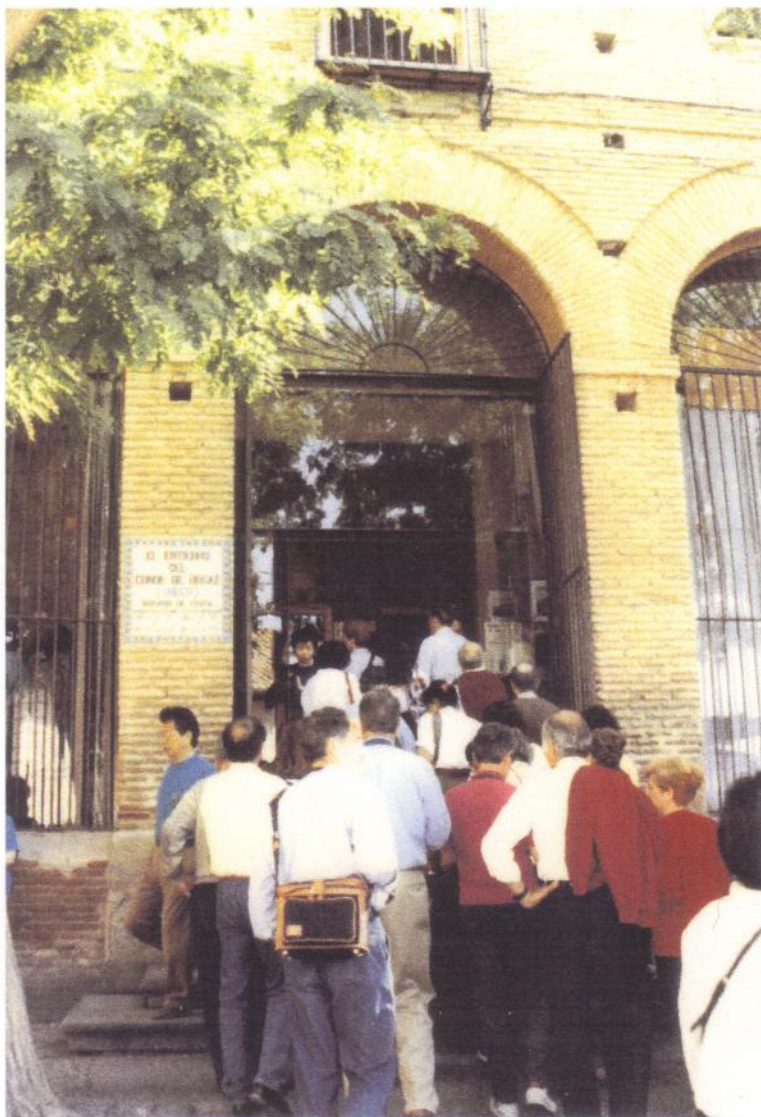
Πενιχρὴ φωτογραφία μου τῆς εἰσόδου τῆς ἐκκλησίας Santo Tomé. Διακρίνεται ἀριστερά τῆς εἰσόδου ἡ ἐπιγραφή EL ENTIERRO DEL CONDE DE ORGAZ (GRECO).

Τόν Ἀπρίλη τοῦ 1992 βρισκόμαστε γιά δουλειά τῆς Μάρως στή Μαδρίτη. Ἐνδιαφέρουσα μεγαλούπολη. Ἐντυπωσιακός ὁ πλοῦτος σέ ἔργα μεγάλης τέχνης τοῦ μουσείου PRADO. Εἶδαμε ἀπό κοντά καί στήν πραγματική της μορφή τή χιλιο-ἰδωμένη σέ φωτογραφίες GUERNICA ἐκτεθειμένη σέ παράρτημα τοῦ PRADO, ὀνομα-σμένο πρὸς τιμὴν τῆς βασίλισσας Σοφίας. Ἐκεῖνο πάντως τοῦ ὁποῦ διατηρῶ ζῶσαν τὴν ἐντύπωση εἶναι τό Τολέδο. Εἶναι ἡ ἀτμόσφαιρα τῆς πόλεως, στοὺς δρό-μους, στὰ σοκάκια, στὰ κτήρια μέσα, στὸν καθεδρικό ναό, παντοῦ πλανᾶται ἡ σκιά τοῦ EL GRECO. Γιά ἐμέ ὀρισμένοι – ἀρκετοί – ἀπὸ τοὺς πίνακες τοῦ Γκρέκο ἀποτε-λοῦν τὴν κορύφωση τῆς ζωγραφικῆς τέχνης. Ἐχω δεῖ ἔργα του σέ πολλά ἀνά τὸν κόσμον μουσεῖα, ὅπως ἔχω δεῖ καί μιά συνταρακτικὴ ἔκθεση ἔργων του στό Μετρο-