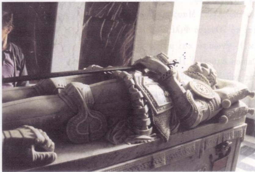
Τό μνημεῖο τοῦ δόν Χουάν

Ἀπό τό ταξίδι αὐτό ἄλλη ἄσβηστη ἀνάμνηση εἶναι ἡ ἐπίσκεψη στό Escorial σέ ἀπόσταση σαράντα χιλιομέτρων ἀπό τή Μαδρίτη. Εἶναι ἓνα γιγάντιο οἰκοδόμημα, ἐπιβλητικό, αὐστηρό, ἄχαρο, γρανιτένιο κυανόφαιου χρώματος. Ἀνάκτορο καί μαζί ναός καί μοναστήρι· ἐπί πλέον βασιλικό πάνθεον, ὅπου ἔχουν ταφεῖ ὅλοι σχεδόν οἱ Ἴσπανοὶ μονάρχες ἀπό τόν Κάρολο Α' (Κάρολο Κουΐντο †1558) ὡς τόν Ἀλφόνσο ΙΓ' (†1941). Ἐκεῖ βρίσκεται καί ὁ τάφος μέ ἐπιτύμβιο μνημεῖο τοῦ δόν Χουάν τῆς Αὐστρίας, τῆς γοητευτικῆς φυσιογνωμίας πού σέ ἡλικία εἴκοσι τεσσάρων ἐτῶν, τόν Ὀκτώβριο τοῦ 1571, ἐπί κεφαλῆς τῶν δυνάμεων τῆς Ἱερῆς Συμμαχίας (στόλοι τοῦ Πάπα, τῆς Ἰσπανίας καί τῆς Βενετίας) ὀρμωμένων ἀπο τήν Κεφαλονιά*,